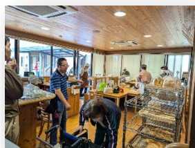
利用者さんが案内してくれました 🍡