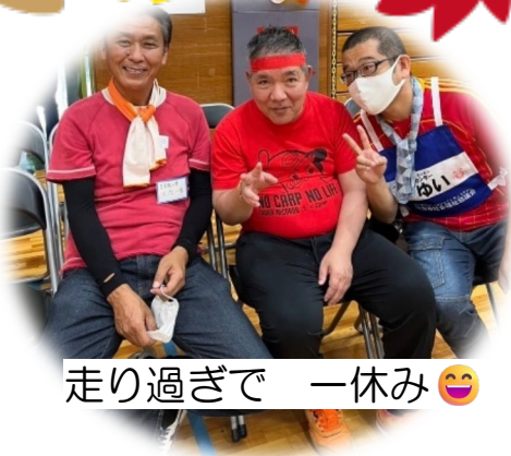
走り過ぎて 一休み 😊

七月十五日(土)に枚方市社会福祉協議会主催の第三四回ふれあいスポーツ交流会が行われました。場所は「出屋敷の里」の南にある「枚方市立総合体育館」で開催されました。出屋敷の里は、今回がはじめて参加しました。当日は出屋敷の里に集合して、体育館に送迎車で向かいました。 利用者さんも、職員も、初めての参加でドキドキわくわく。緊張からか、当日お休みの方もいらっしやいました。利用者さん十二名と職員十名楽しい一日となりました。リレーでは出屋敷の里が断トツのトップになったのですが私たちが所属する紅組は総合では第三位でした。来年は優勝しましょう