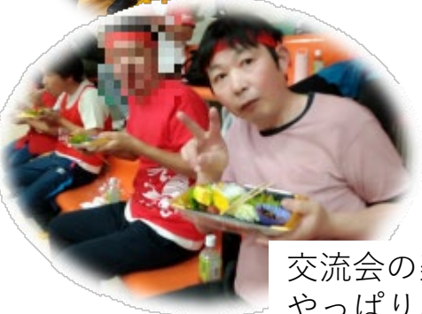
交流会の楽しみはやっぱりお弁当！ 😊