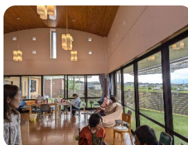
施設はのどかな場所にあります 🍡