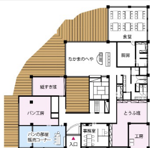
広くてきれいな施設でした