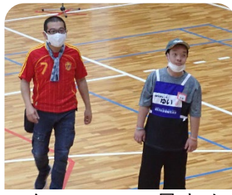
スタッフの一員としても頑張りました