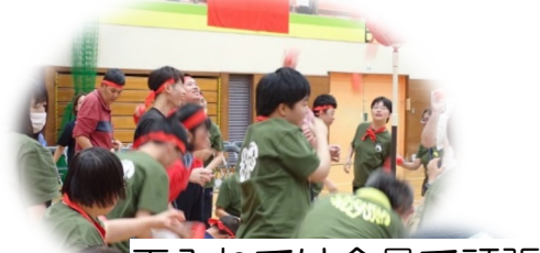
玉入れでは全員で頑張りました