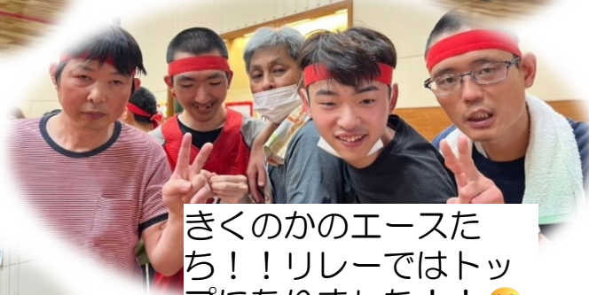
きくのかのペースたち！！リレーではトップになりました！！ 😊