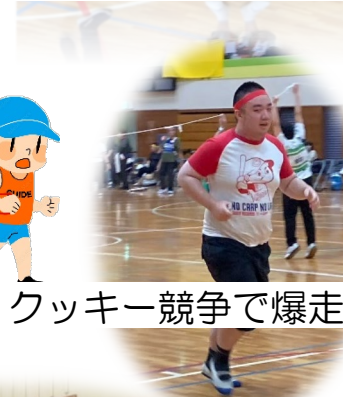
クッキー競争で爆走