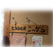
豆腐やパンを作って販売していました 🍡